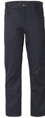
ZX – AZUL/NEGRO