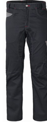
ZY – NEGRO/GRIS