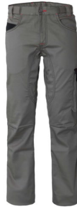
GY – GRIS/NEGRO