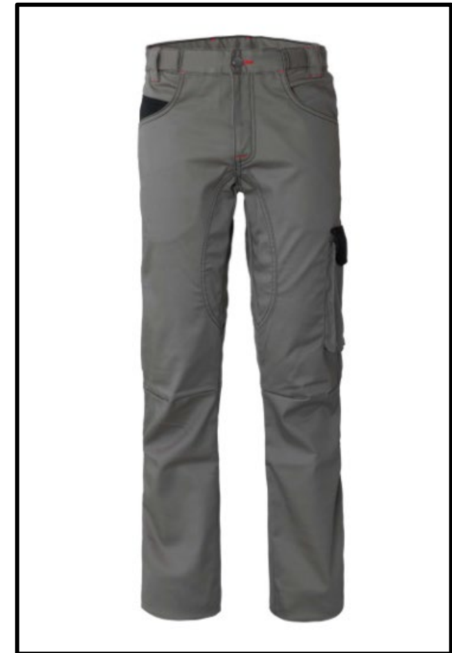
GY – GRIS/NEGRO