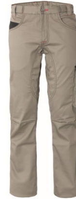
XA – BEIS/NEGRO